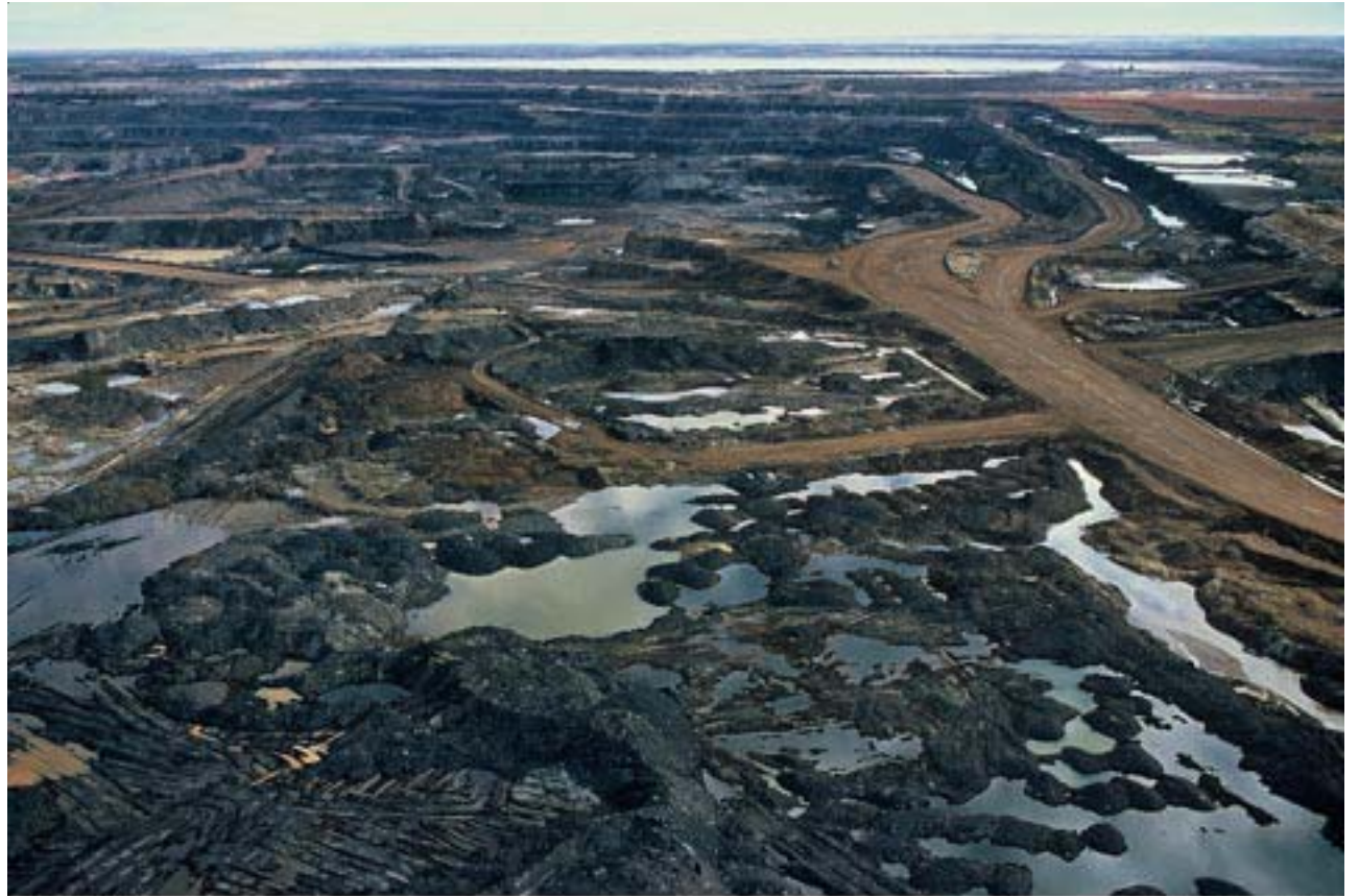
Alberta Tar Sands

Our government is putting all its eggs in one basket, relying on the tar sands to fuel the economy.