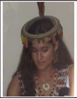
Q'orianka Kilchner pág.12