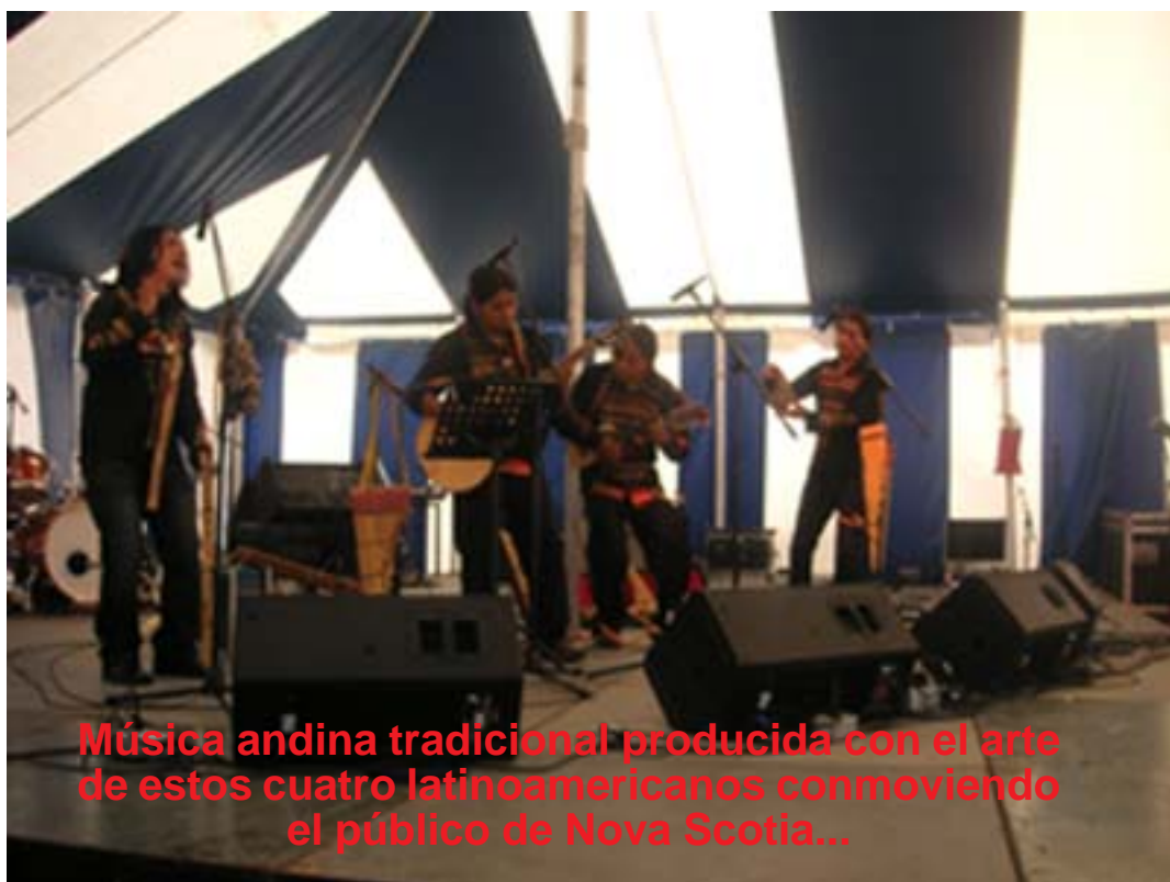
Música andina tradicional producida con el arte de estos cuatro latinoamericanos conmoviendo el público de Nova Scotia...