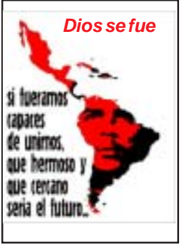
Dios se fue.